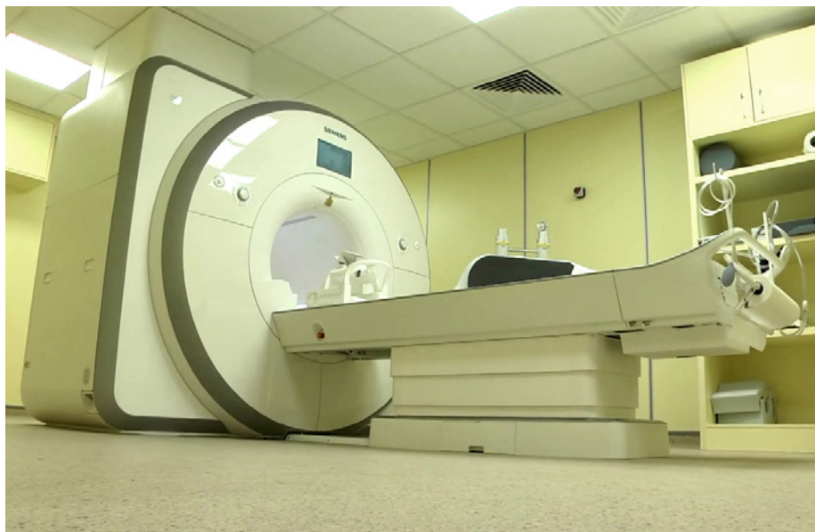
Szpital w Ostrowcu Świętokrzyskim wzbogacił się o nowoczesny rezonans magnetyczny.

- Mamy teraz urządzenie bardzo potrzebne w diagnostyce, z którego korzystają pacjenci nie tylko z naszego powiatu, ale z całego województwa - mówił podczas otwarcia pracowni dyrektor