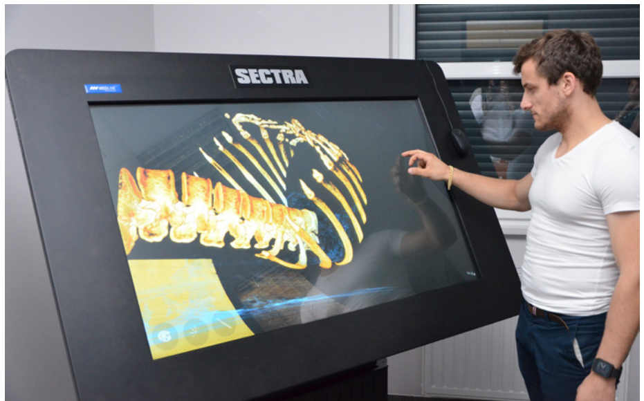
Pracownia multimedialna z wirtualnym stołem - coś takiego posiada kilka uczelni w kraju.

Wydział dysponuje dwiema aulami wykładowymi - jedna na 200, druga na 300 osób. Obie z możliwością podzielenia na