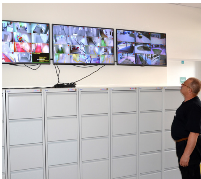
Cały szpital jest monitorowany i dozorowany przez całą dobę.