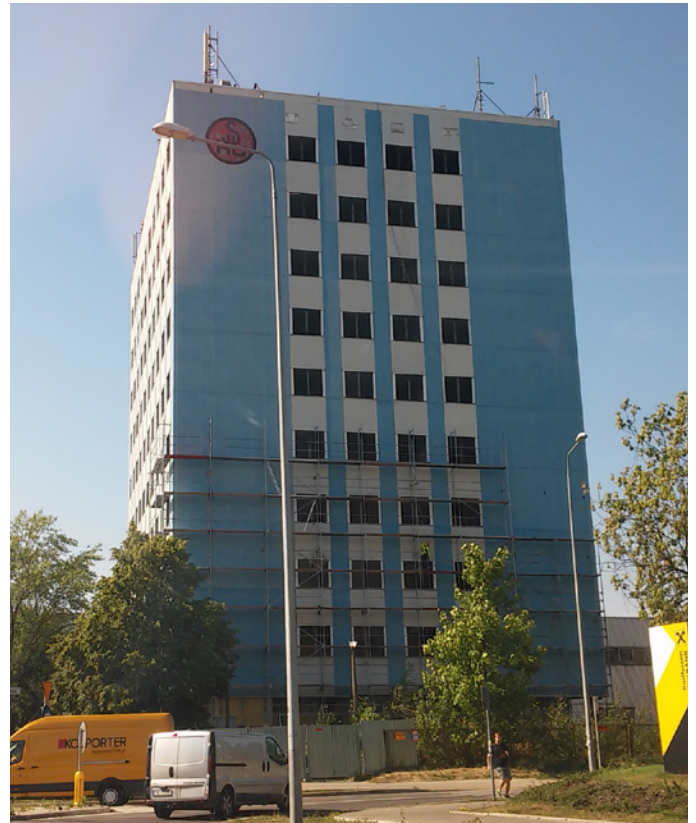
W tym biurowcu powstanie kompleks przychodni.

Kolejnym celem zakupu biurowca jest stworzenie wspólnie ze spółką Promyk Zdrowia, będącej koordynatorem klastra Nauka Medycyna i Nowoczesne Technologie, ośrodka naukowo-badawczego na światowym poziomie, który będzie zajmował się badaniami nad opracowywaniem nowych materiałów i technologii, stosowanych w medycynie, farmacji i biotechnologii. Placówka rozpocznie ścisłą współpracę z zapleczem badawczym budowanym przy Szpitalu Kieleckim.