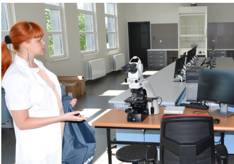
W tej pracowni obraz z mikroskopu przekazywany jest na monitory studentów.