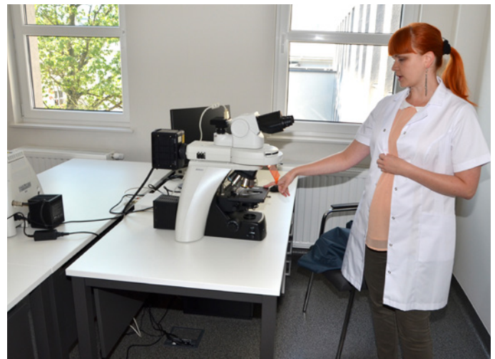
Uczelnia posiada nowoczesny mikroskop elektrony.