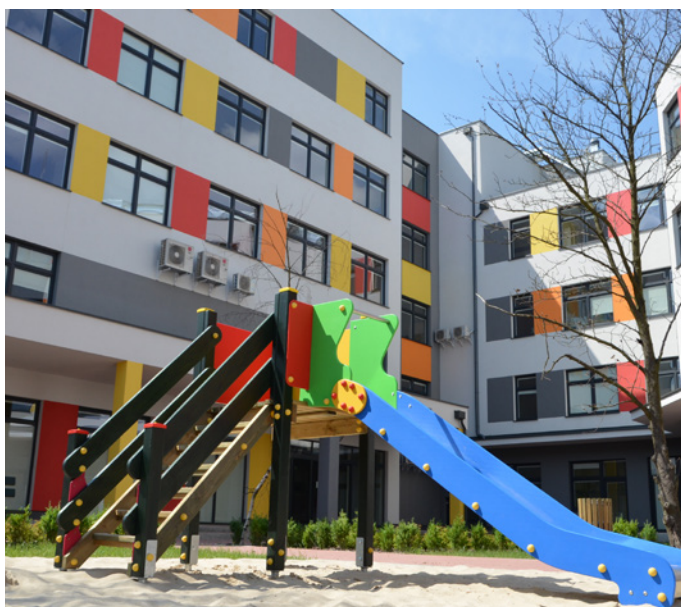
Przed budynkiem znajduje się plac zabaw.