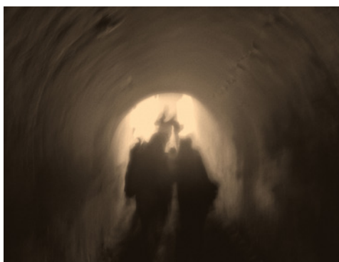
Konkursowe zdjęcie „Ludzie tak szybko...”.