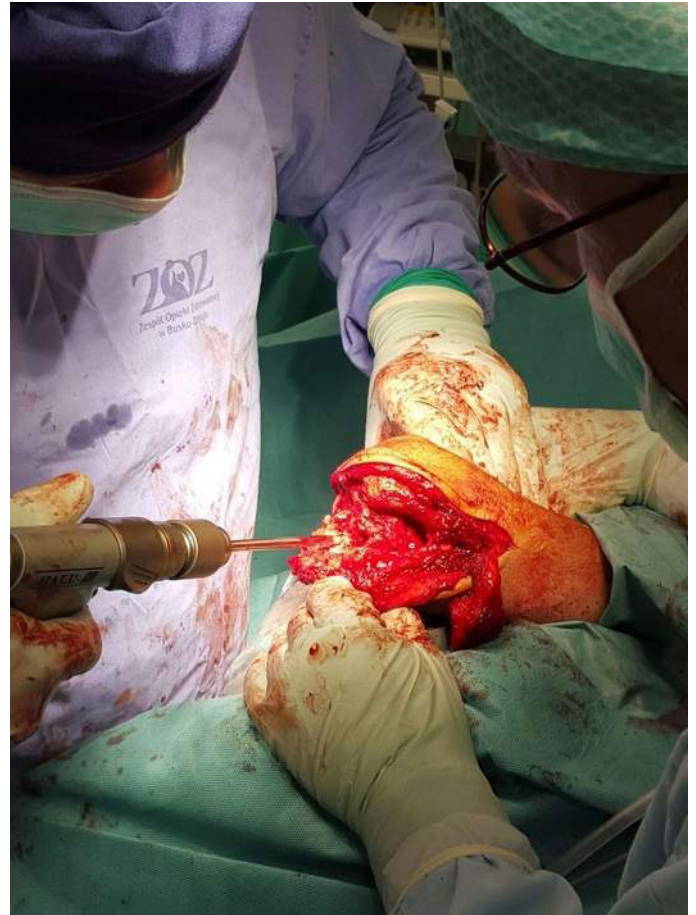
Podczas zabiegu w buskim szpitalu.

W oddziale realizowane są również zabiegi z zastosowaniem endoprotez stawu barkowego, kolanowego, biodrowego w ramach kontraktu z Narodowym Funduszem Zdrowia.