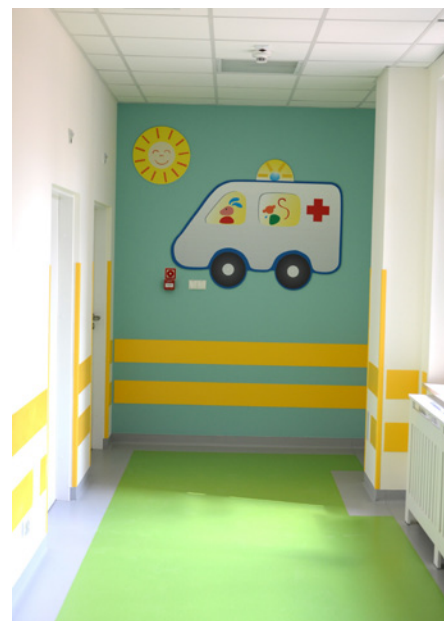
Na szpitalnych korytarzach widnieją kolorowe malowidła.