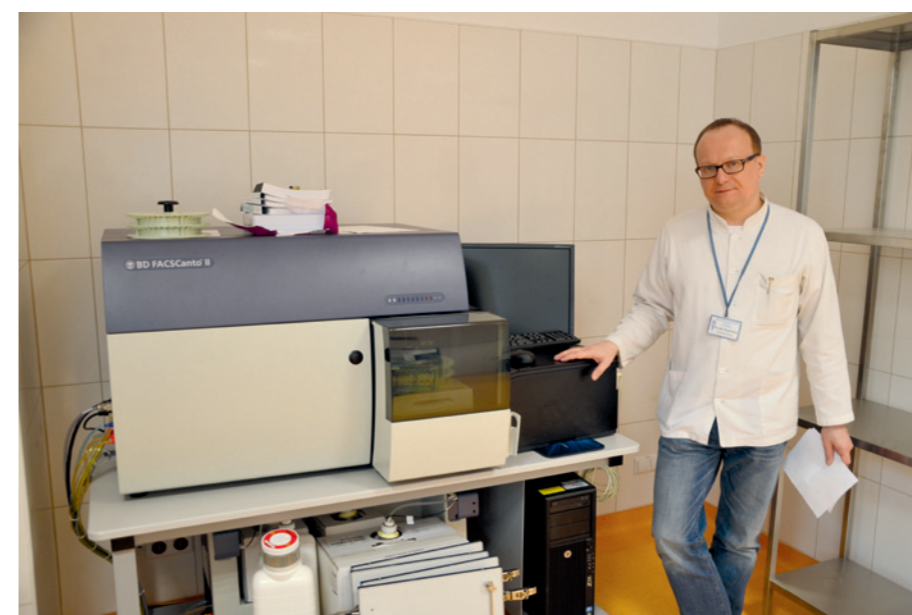
Klinika ma nowoczesny sprzęt, ten laserowy cytometr kosztował blisko 500 tys. zł.