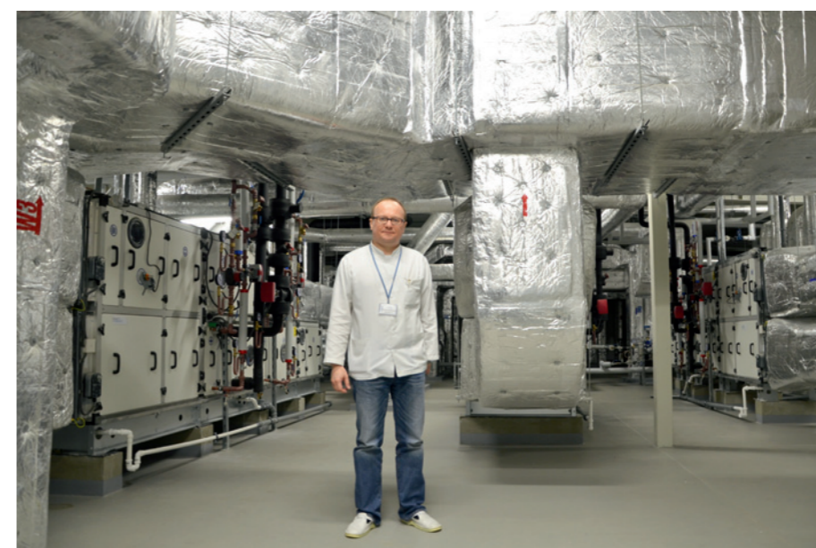
Centrale klimatyzacyjne zajmują całe jedno piętro budynku - 800 metrów kwadratowych.