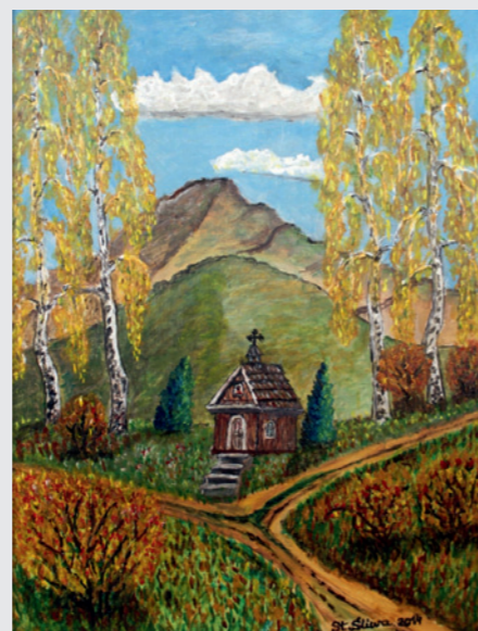
„Kapliczka” - jesienny pejzaż - St. Śliwa, akryl.

Przy rozstajnych ścieżkach w kwitnącej dolinie przykucnęła mała gontowa kapliczka spogląda ku górcom strzegą jej spokoju zamyślane brzozy w jesiennych sukienkach szafirowe niebo czesze włosy w chmurach przy kamiennych schodkach gorejące krzewy pyszną się czerwienią a w środku kapliczki zamkniętej na skobel odpoczywają zmęczone Anioły Barbara Kocela