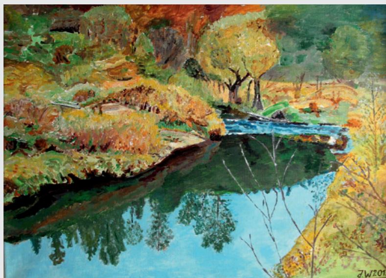
„Lubrzanka” - Janusz Wiśniewski akryl.