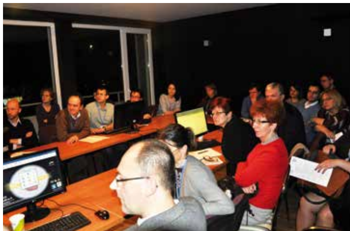
Zajęcia praktyczne – analiza zapisu Holtera ekg