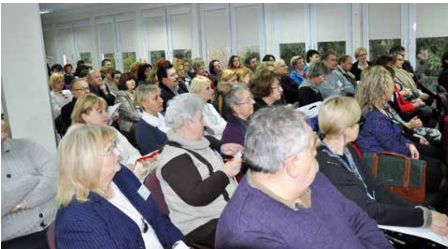
Uczestnicy wykładów z orzecznictwa stopnia niepełnosprawności