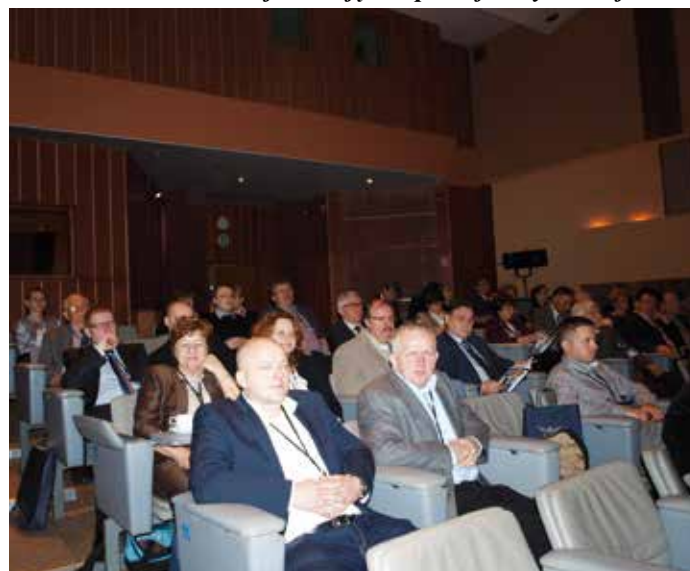
Uczestnicy Zjazdu, delegacji z tzw. terenu, ze Staszowa, Jędrzejowa, Buska. Ogółem na 162 wybranych delegatów na Zjazd przybyło ich 117.