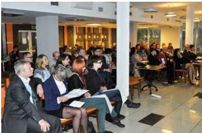
Wykład sesji Sekcji Elektrokardiologii Nieinwazyjnej i Telemedycyny