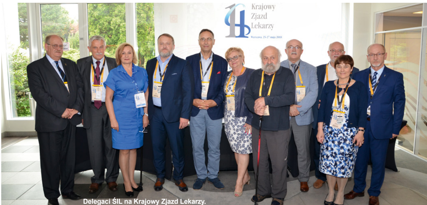
Delegaci ŚIL na Krajowy Zjazd Lekarzy.