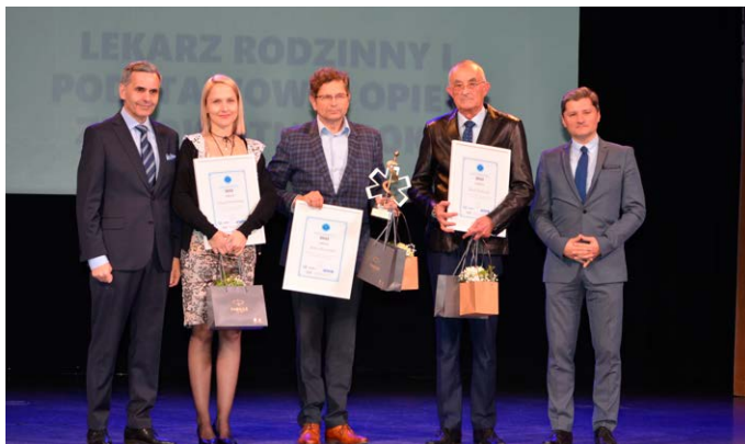
Laureaci w kat. Lekarz Rodzinny, Lekarz POZ w Świętokrzyskiem