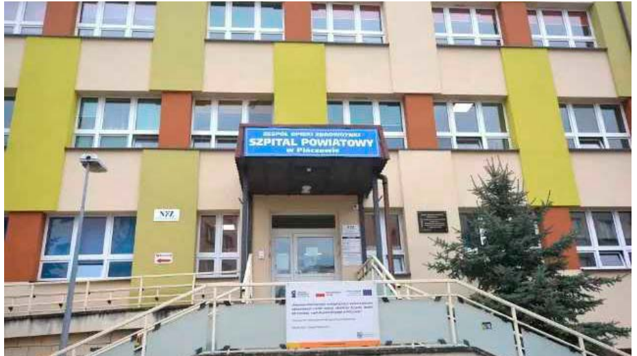
Szpital Powiatowy w Pińczowie

Dzięki dofinansowaniu, przekazanemu lecznicy przez władze powiatu pińczowskiego, zakupiony został nowy sprzęt, który pozwala na operowanie w zakresie jamy brzusznej, tarczycy, żylaków, podu-