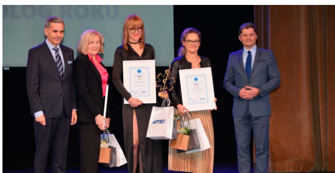
Laureaci w kategorii Dermatolog Roku w Świętokrzyskiem