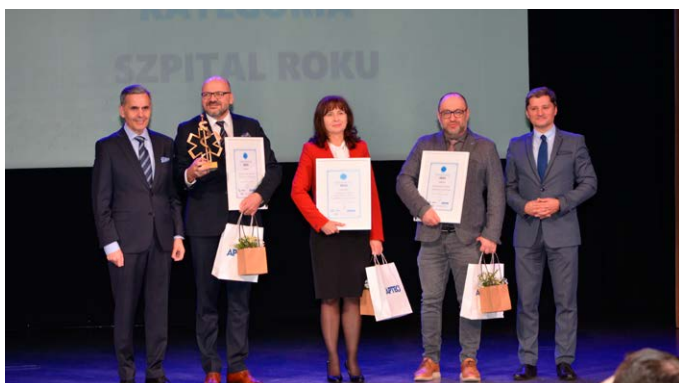
Laureaci w kategorii Szpital Roku