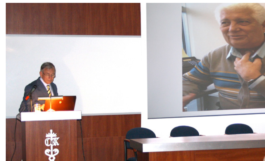
Profesor Fons Balm podczas konferencji w Kielcach.

W czasie konferencji zostały przeprowadzone zabiegi całkowitej laryngektomii wraz z wytworzeniem przetoki tchawiczo-przełykowej oraz implantacją protezy głosowej oraz zabiegi wtórnej implantacji protezy głosowej u pacjentów po wcześniejszym usunięciu krtań. Kluczowe etapy operacji były transmitowane na żywo z sali operacyjnej. Mówiono też o różnicach w technice