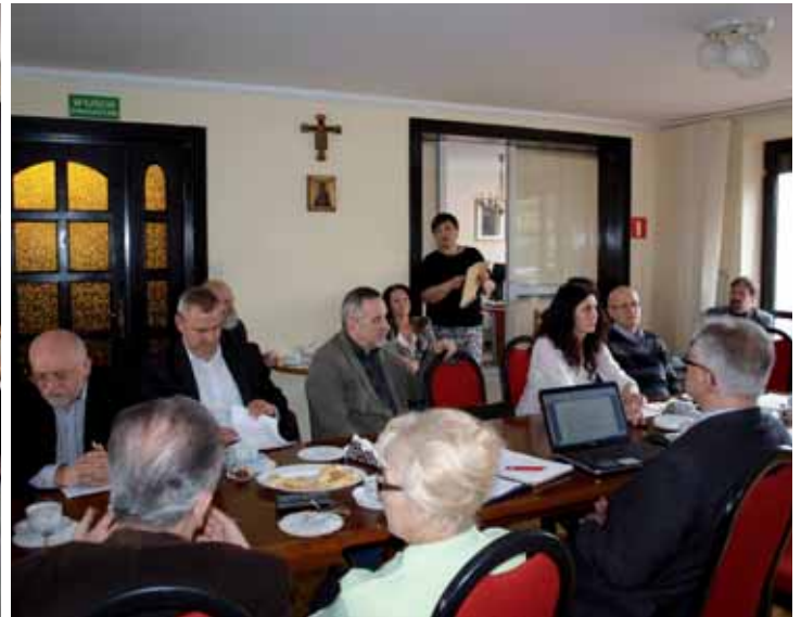
24 kwietnia 2013. Posiedzenie Okręgowej Rady Lekarskiej ŚIL. Dyskutowano o bieżących sprawach z życia Izby, w tym omawiano kalendarz wyborczy, oceniając pozytywnie dotychczasowy przebieg wyborów.