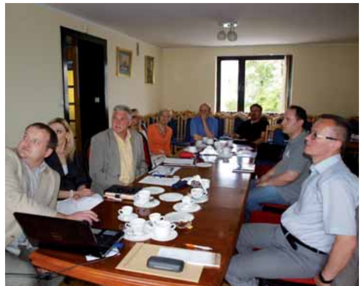
22 maja 2013. Prezydium ORL ŚIL z udziałem przedstawicieli firm: AMILL (z prawej) oraz Tamall (z lewej). Omawiano różne aspekty ubezpieczeń lekarzy od odpowiedzialności cywilno-prawnej.