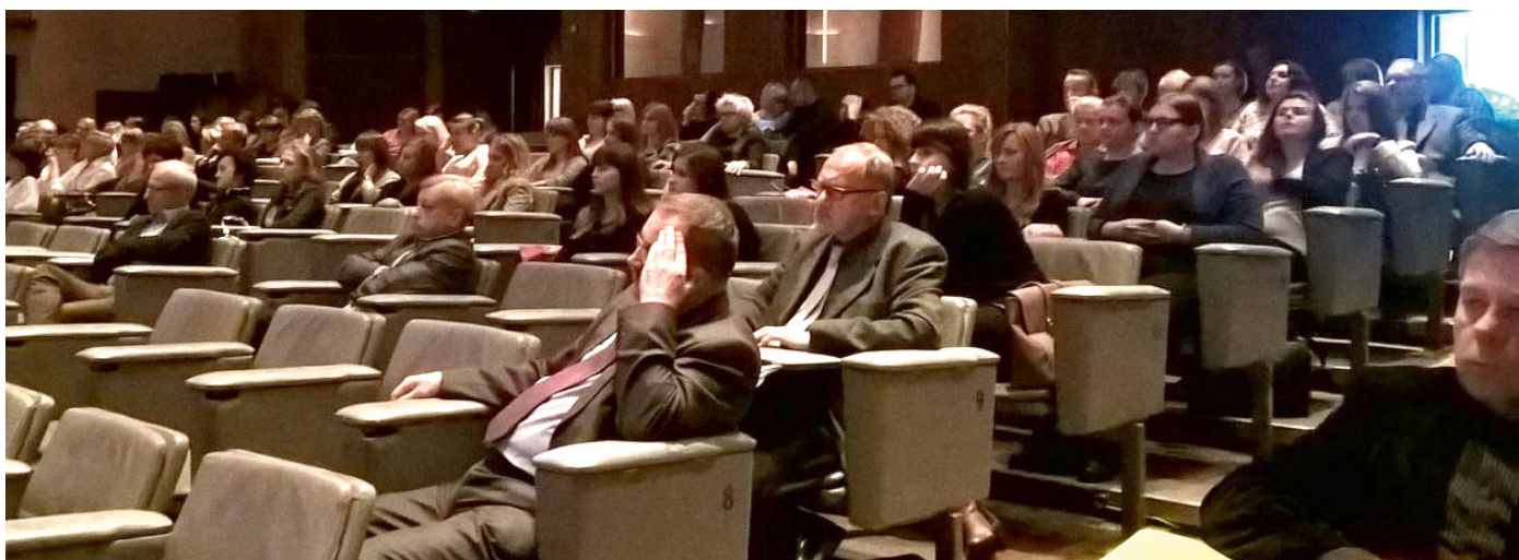
Podczas konferencji w Kieleckim Centrum Biznesu.

Konferencję Bezpieczny Poród 2015 zorganizowały w Kielcach oddziały: świętokrzyski i radomski Polskiego Towarzystwa Ginekologicznego, Świętokrzyski Oddział Polskiego Towarzystwa Neonatologicznego oraz Wydział Lekarski i Nauk o Zdrowiu Uniwersytetu Jana Kochanowskiego w Kielcach. Równoległe ze spotkaniem naukowym odbywały się warsztaty dla kobiet, w ramach Akademii Przyszłej Mamy.