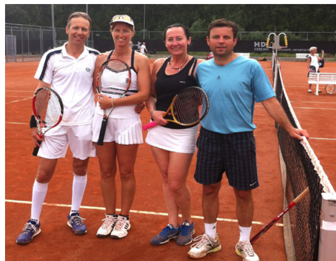
Mistrzowie i wicemistrzowie świata w mikście.