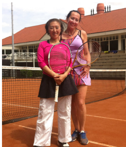
Przed pojedynkiem grupowym z rep. Japonii.