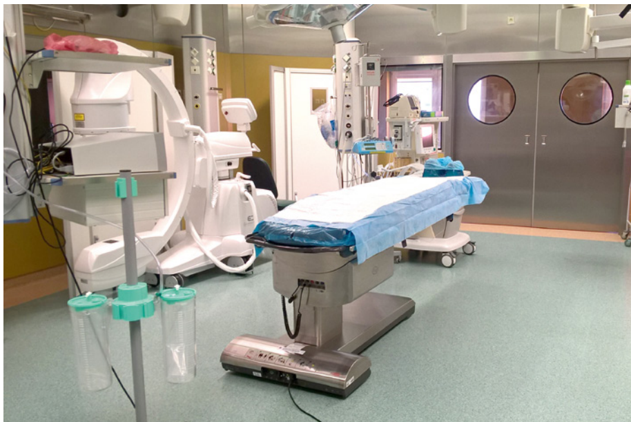
Ta sala operacyjna na kardiochirurgii WSZz w Kielcach wkrótce zamieni się w hybrydową.

Ministerstwo Zdrowia przyznało Wojewódzkiemu Szpitalowi Zespolonemu 1 mln 300 tysięcy złotych na stworzenie sali hybrydowej.