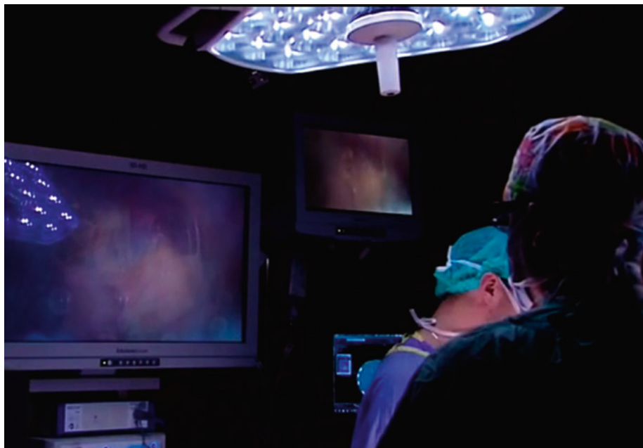
Buscy ortopedzi podczas zabiegu.

W 2001 roku jako pierwszy w Polsce przeprowadził operację stawu ramiennego