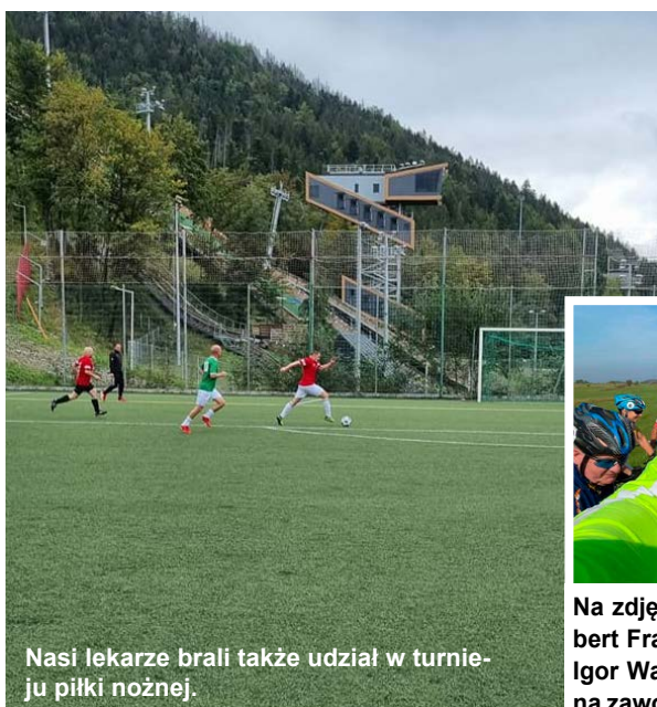
Nasi lekarze brali także udział w turnieju piłki nożnej.