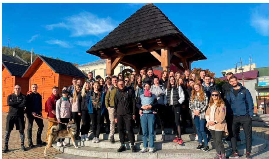
Uczestnicy rajdu na Rynku w Chęcinach.

Od godziny 9.00 w towarzystwie przewodnika PTTK oraz pięknej pogody uczestnicy rajdu maszerowali niezwykle malowniczą trasą wiodącą przez lasy, mijając kolejno Jaskinię Raj, Sitkówkę, Rezerwat Biesak-Białogon meldując się około godziny 16 na kieleckim Stadionie. Wycieczka zwieńczona została poczęstunkiem przygotowanym przez Binkowski Dworek. Był to czas wspólnej zabawy, tańców, wzajemnej integracji, zawiązywa-