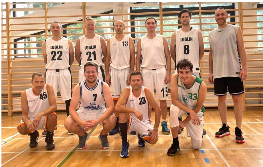
Reprezentacja Świętokrzyskiej Izby Lekarskiej w koszykówce odniosła historyczne zwycięstwo - zdobyła złoty medal na 19. Igrzyskach Lekarzy w Zakopanem.