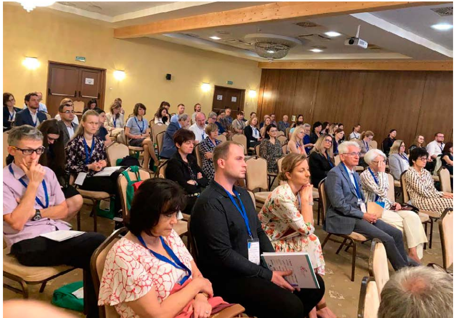
Frekwencja na wszystkich wykładach była niemal stuprocentowa.