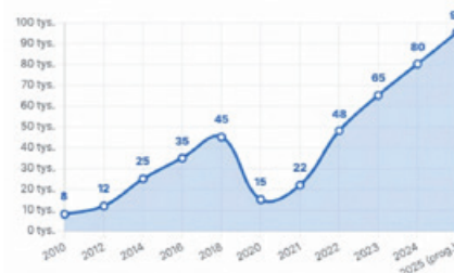
Dynamika wyjazdów Polaków na leczenie (2010-2025)

Skala zjawiska (prognozowany wzrost rynku o 15% rocznie) wymaga od systemów przejścia do ofensywy legislacyjnej. Bo czy system publiczny powinien bezrefleksyjnie płacić za skutki świadomie podjętego ryzyka w placówkach niecertyfikowanych? Należałoby rozważyć mechanizmy zwrotu kosztów od podmiotów komercyjnych lub ubezpieczycieli. Każdy wyjeżdżający na zabieg komercyjny powinien posiadać polisę z sumą gwarancyjną min. 100 000 PLN, pokrywającą koszty leczenia naprawczego w Polsce. Powinien istnieć ustawowy system zwalniania lekarzy ratujących pacjenta po błędach zagranicznych operatorów z odpowiedzialności i ochrona prawna dla procedur naprawczych. Polska nie powinna być „ubezpieczalnią ostatniej szansy” dla zagranicznego biznesu. Turystyka medyczna w obecnym kształcie to eksport zysków i import powikłań. Warto zacząć dyskusję na ten temat, bo każdy lekarz i lekarz dentysta może stać się ofiarą braku uregulowań w tej kwestii.