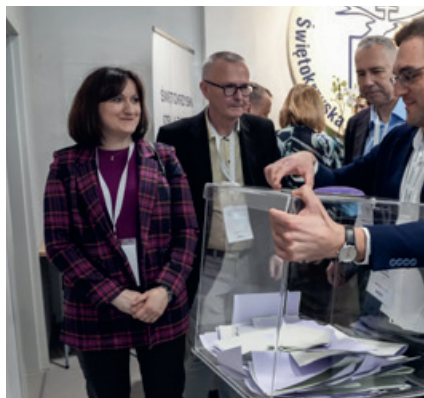
Komisja Wyborcza udaje się na liczenie głosów