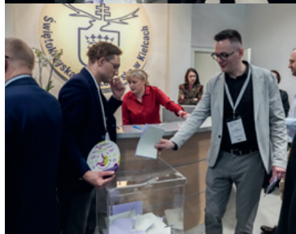
Wybory w ŚIL