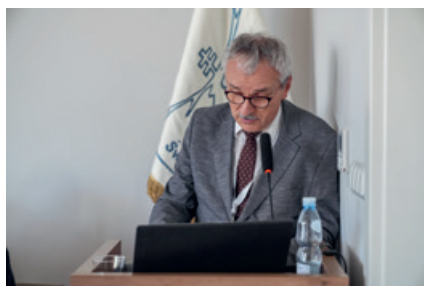
Sprawozdanie Komisji Mandatowej