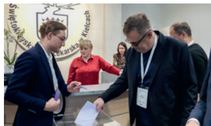
Wybory w ŚIL

Najważniejszym punktem obrad, były wybory, które zdefiniowały skład organów Izby na lata 2026–2030. Na zdjęciach widać skupienie i życzliwość delegatów oraz sprawną pracę Komisji Wyborczej, która czuwała nad prawidłowością każdego oddanego głosu.