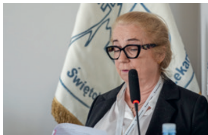
Sprawozdanie Skarbniczki za rok 2025

Przedstawiono szczegółowe sprawozdania z działalności Okręgowej Rady Lekarskiej, Skarbnika, Komisji Rewizyjnej oraz Okręgowego Rzecznika Odpowiedzialności Zawodowej i Okręgowego Sądu Lekarskiego. Delegaci zapoznali się ze sprawozdaniem i po merytorycznej dyskusji, Zjazd zatwierdził sprawozdania i udzielił absolutorium ustępującej Radzie.