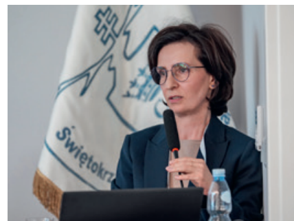
Prezes IX i X Kadencji ORL ŚIL

działania na rzecz rozwoju nowoczesnej Izby Lekarskiej, dbającej o interesy lekarzy i kierującej się zasadami medycyny opartej na dowodach naukowych (EBM).