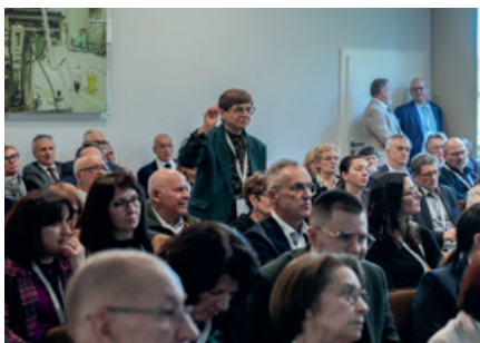
Na zdjęciach: dyskusje zjazdowe