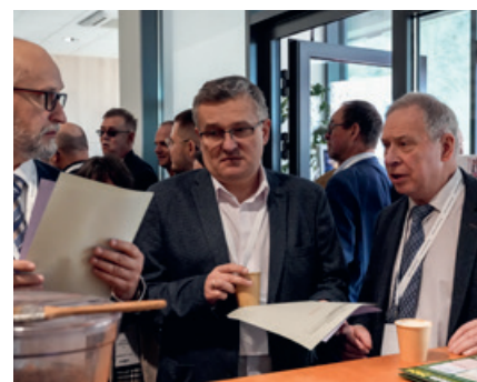
Na zdjęciach: spotkania w kuluarach

Wspólnie wchodzimy w X kadencję z silnym mandatem do działania, gotowi do realizacji priorytetów w zakresie etyki, nauki i ochrony prawnej członków Izby.