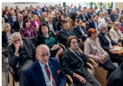
Delegaci XLV Sprawozdawczo-Wyborczego OZL

Obrady rozpoczęły się o godzinie 9:00 od uroczystego otwarcia i przywitania przybyłych lekarzy. Po wyborze prezydium Zjazdu oraz komisji mandatowej i uchwał, delegaci przystąpili do kluczowej części sprawozdawczej.