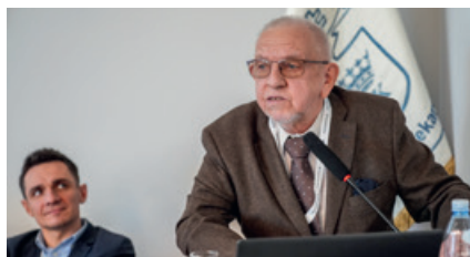
Sprawozdanie Komisji Rewizyjnej za rok 2025